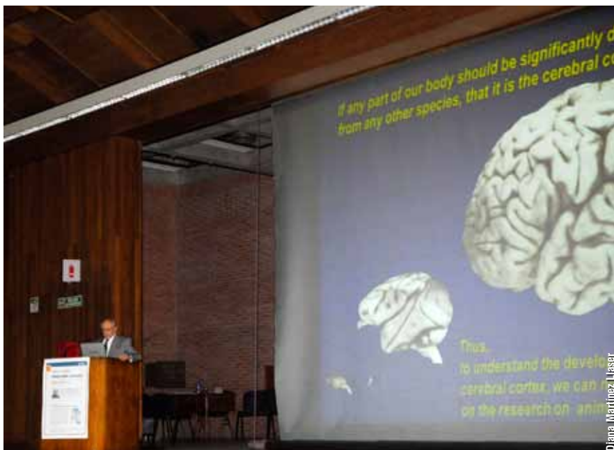
Rakic sostiene que, a diferencia de lo que sucede en otros tejidos y órganos del cuerpo, las células de la corteza cerebral no se renuevan. “Si no, no podríamos recordar todo aquello que aprendemos a lo largo de la vida. Uno se olvidaría de lo que aprendió en la escuela primaria, o no podría reconocer a la madre, porque su imagen estaría archivada en neuronas perdidas”, afirma.

La corteza cerebral brinda el soporte biológico para la capacidad cognitiva del ser humano. Por lo tanto, comprender la