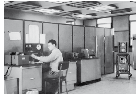
Pág. 5 ►

El jueves 12 y viernes 13 de mayo se llevarán a cabo las "Jornadas Manuel Sadosky" en el Pabellón I, con charlas abiertas a todo público donde expondrán su experiencia muchos de los pioneros de la computación en la Argentina. También hay previstas para el 50 aniversario diversas actividades como concursos literarios, de programación y obras de teatro.