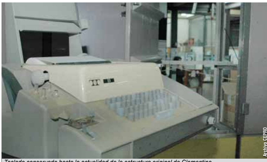
Teclado conservado hasta la actualidad de la estructura original de Clementina.

Para conocer el detalle de las actividades así como el cronograma de las charlas de las Jornadas Manuel Sadosky, puede consultarse la página web del Departamento de Computación: www.dc.uba.ar .