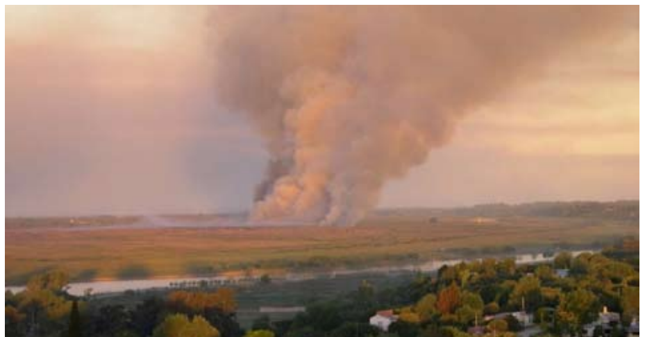
De acuerdo con una fuente de la Secretaría de Ambiente y Desarrollo Sustentable, el incendio en el Delta afectó 180 mil hectáreas y no 70 mil como informaron los medios. Esto representa un 10 por ciento de la superficie de la región.