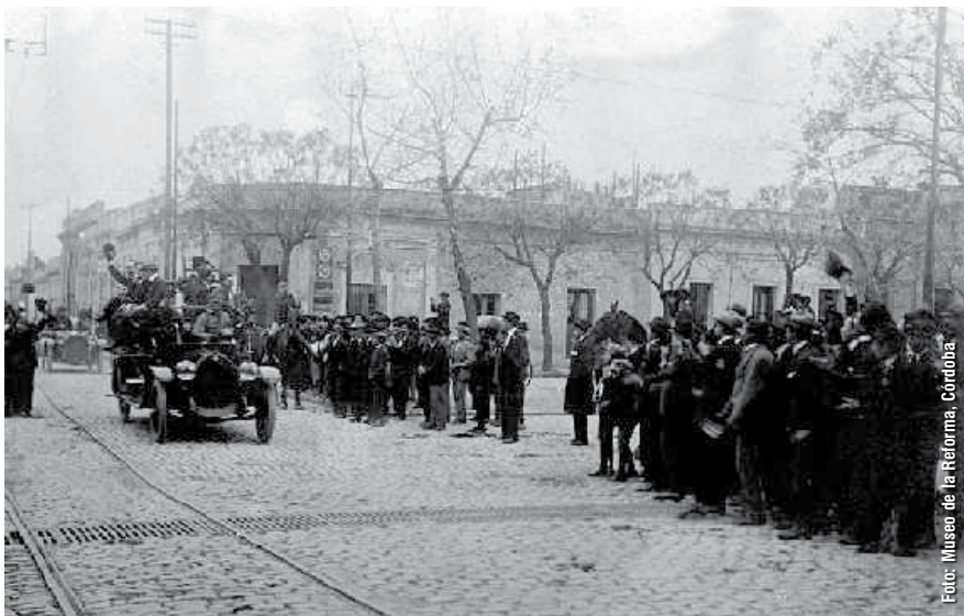
Dirigentes reformistas saludan mientras son trasladados a la jefatura policial