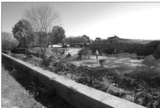
Trabajadores al comienzo de la obra