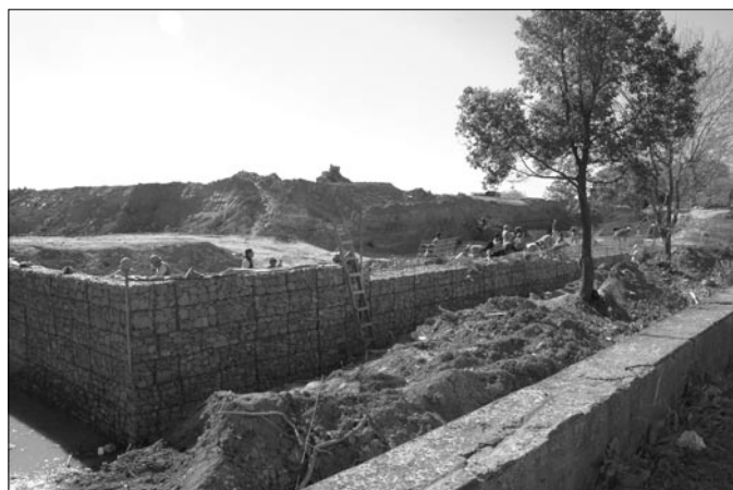
Las obras en estado avanzado frente al Pabellón II