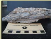
Fig. 3 Roca sedimentaria

Las rocas metamórficas (véase fig. 5) se forman cuando cualquier tipo de rocas es sometida a la acción de las altas temperaturas y la presión. Es un proceso lento que da lugar a un nuevo conjunto de rocas con rasgos (texturas) características.