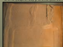
Fig. 6d Modelo N° 4 se observa en la parte superior (arena húmeda, cohesiva) un corrimiento mayor.