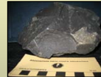
Fig. 4b Roca extrusiva