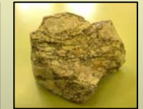
Fig. 5 Roca metamórfica