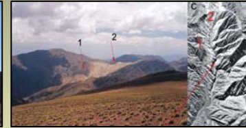
Fig. 1b: Detalle de la deformación de las rocas de Precordillera (Rincón Blanco). Pliegue sinclinal, en areniscas (color blanco) y foto aérea escala 1:50000