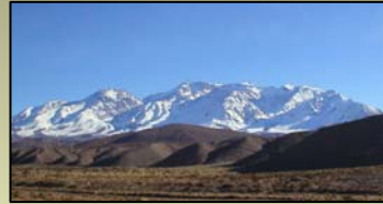
Fig. 1a: Imagen de la Precordillera Sanjuanina

El área de estudio comprende la región de la Precordillera Sanjuanina (véase figura 1), se encuentra ubicada al W 69° 30' de longitud y al S 31° 30'. Los objetivos del presente trabajo consisten en estimar la influencia que ejercen los distintos tipos de rocas con diferentes valores de cohesión y fricción basal. Luego obtenidos los resultados comparar los mismos con imágenes satelitales del satélite Landsat 7 sensor ETM+.