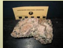
Fig. 4a Roca intrusiva