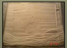
Fig. 6b Modelo N° 2 con base de papel de lija (izquierda) y acetato (derecha).