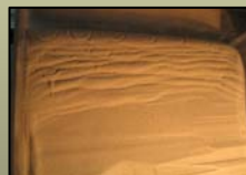
Fig. 6a Modelo N° 1 se utilizó arena seca

Se realizaron 4 experimentos de los cuales cada uno contenía una característica particular ya sea diferentes materiales y/o en distintas condiciones. Se tomaron fotografías de cada uno de los experimentos mostrando, finalizado el mismo. (Véase fig. 6a, b, c y d).