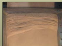
Fig. 6c Modelo N° 3 observamos el comportamiento de los materiales arena (izquierda) y arcilla (derecha).