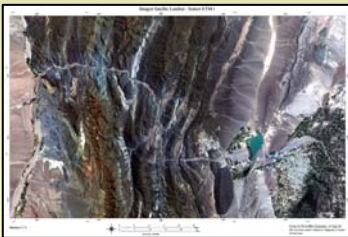
Fig. 2a Escena de la Precordillera con las bandas 321